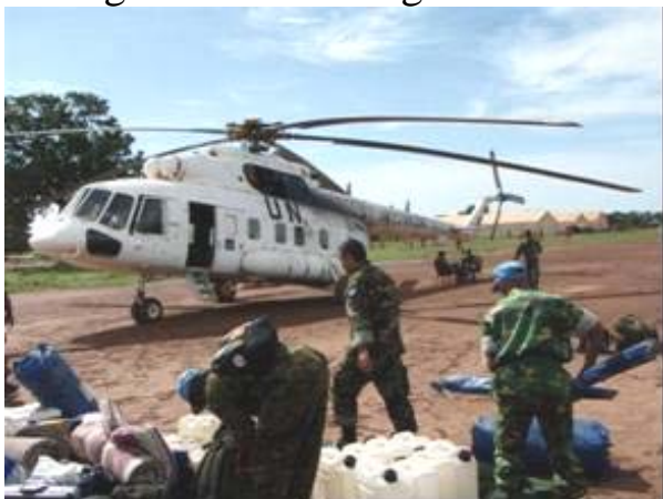
Helikopter pickup af long range patrulje til Gok Machar.

den humanitære situation. Informationerne om den humanitære situation viderefremmes til de forskellige hjælpeorganisationer som arbejder i området. Long range patruljer gennemføres som medium range patruljer, idet der minimum er en eller flere overnatninger i terrænet i forbindelse med patruljen. Ud over de overnævnte patruljer anvendes der også Air patruljer, hvor JMT bliver indsat med helikopter. Formålet med anvendelse af helikopter er at nå områder som ikke kan nås med bil. Specielt i regnsæsonen er der mange områder hvor vejene er oversvømmet og ufremkommelige.