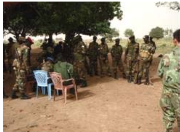
Optælling og fotografering af soldaterne i JIU

Inden min første orlov gennemførte jeg en optælling af JIU enheden som er stationeret i Aweil. Enheden består af ca. 1.400 soldater som alle blev fotograferet individuelt. Billederne blev herefter indsat i en nominall roll list. Et kæmpe arbejde som krævede en del forberedelse. Men det lykkedes for TS at gennemføre arbejdet og få det afsluttet på ordentligt vis.