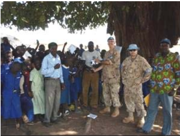
Bil tv. og James overrækker fodbolde på en skole i Aweil

En del af skolerne i området er de såkaldte under træet skoler. En under træet skole er et træ hvor eleverne mødes, og undervisningen forgår i skyggen under træet. En lærer har typisk mellem 80 og 120 elever som han skal undervise på en gang. Danske børn skulle bare vide hvor privilegerede de er.