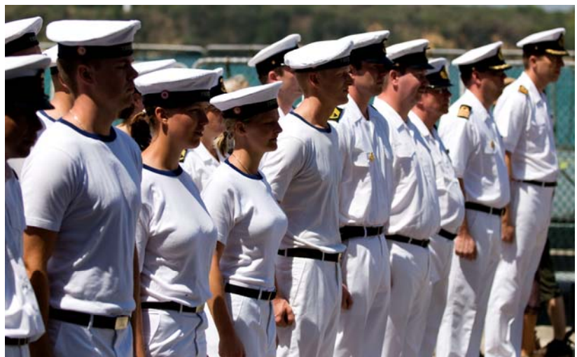
Overdragelsesparade d. 2. februar 2008.