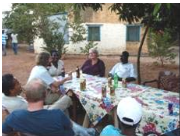
Hyggeaften i Mango Villa

Ud over hvad man kan købe på markedet er det også muligt at spise på de lokale "spisesteder". Man skal dog være klar over at råvarerne kommer fra markedet og de heller ikke har noget køleskab. Men maden smager fint kvaliteten er der ikke noget at udsætte på og jeg har ikke haft problemer med maven efterfølgende.