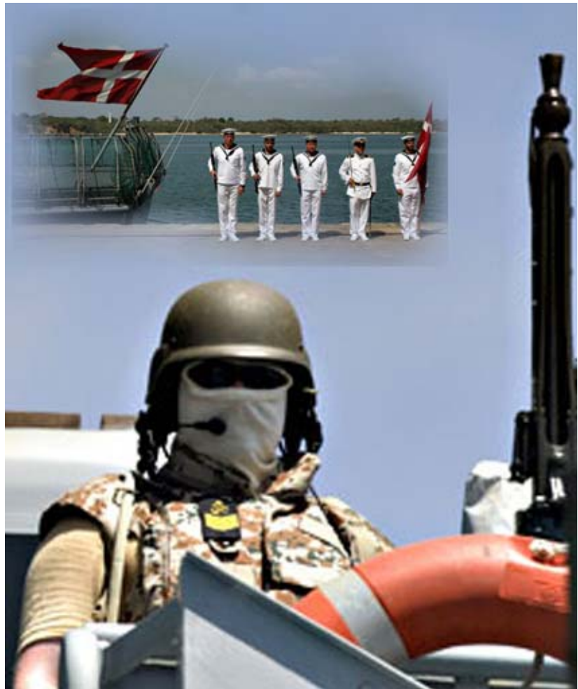
Vagten er klar på inspektionsskibet Thetis.

FN Museet Frøslevlejren 6330 Padborg Tlf.: 7467 6855 www.fnmuseet.dk