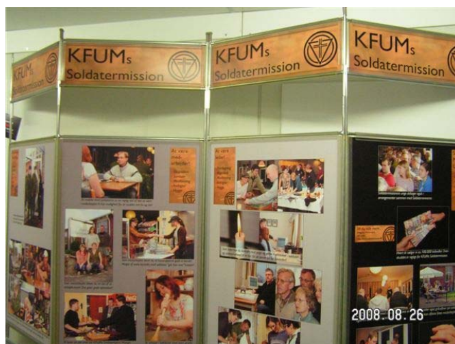
Billedet er fra særudstillingen i 2008 omhandlende KFUMs Soldatermissions virke.

Temaudstillingen, som sidste år omhandlede KFUMs Soldatermissions virke, bliver i år erstattet af noget helt andet.